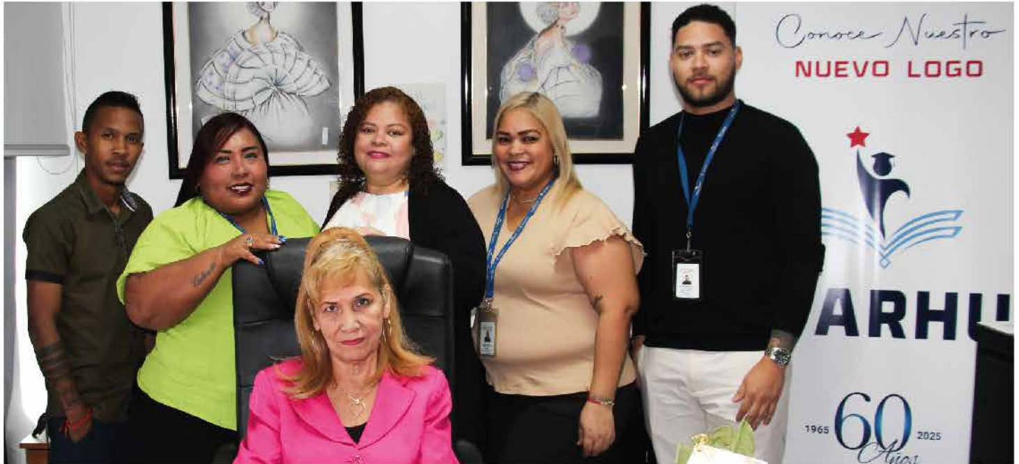
El equipo humano detrás de esta gran cruzada. Felicitaciones

En pocos meses de haber iniciado la actual administración, se logró el descarte de equipo informático y de oficina deteriorados, además del chatarreo de 8 vehículos tipo sedán y pick up 4x4, con hasta 20 años de desuso