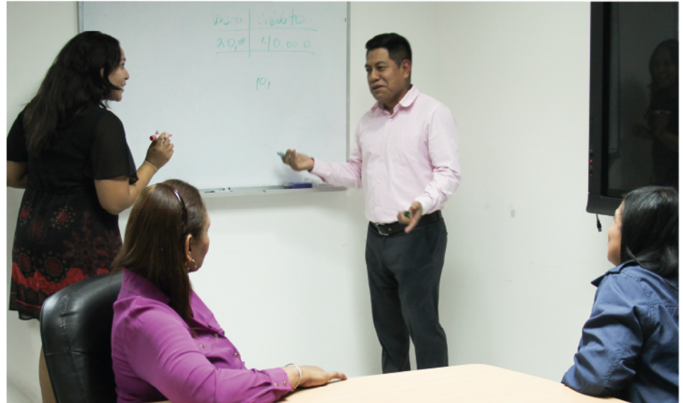
Un equipo humano comprometido

MiWallet, para registrar en el Manual de PASE-U, y junto a otros manuales como del Departamento de Transporte, que buscan, en este caso, dar seguimiento al uso de los bienes estatales.